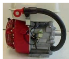
Ölmesstab lang GX 160-K10-26 35.-