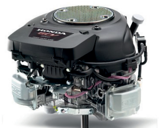
GCV 530 Seite 7