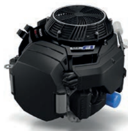
iGXV 700 / 800 Seite 7