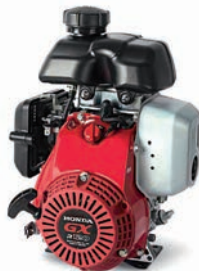
GXR 120 Seite 2