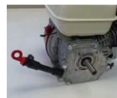
Ölmesstab kurz GX 390-K10-01 40.-