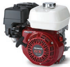
GX 120 / 160 / 200 Seite 2