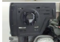
Abgasabweiser kurz GX 20000000 6.-