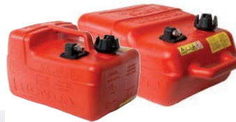
Kraftstofftank 13 Liter inkl. 3 Meter Schlauch mit Handpumpe, RGM 17500-ZV4 175.-