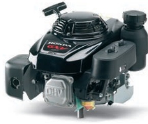
GXV 160 Seite 6