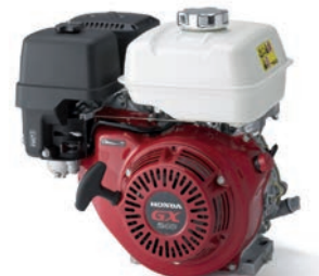
GX 240 / 270 Seite 3