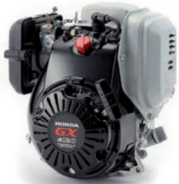
GX 100 / GXR 120 Rammer Seite 5