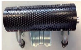
Auspuff rechts Ausgang Ölfilter Seite 06183-ZCK-000 285.-