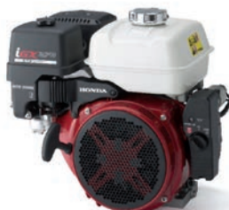
iGX 270 / 390 Seite 4