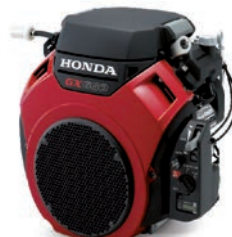
GX 630 / 690 Seite 4