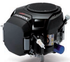
GXV 630 / 690 Seite 7