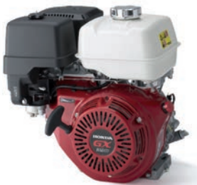
GX 340 / 390 Seite 3