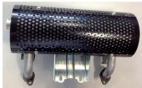
Auspuff links Ausgang Starter Seite 06183-ZCK-800 285.-