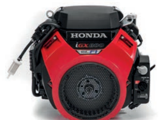
iGX 800 Seite 4