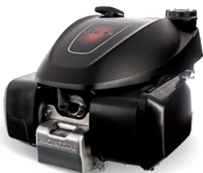
GCVx 145 / 170 / 200 Seite 6