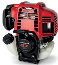
GX 25 / 35 / 50 Seite 7