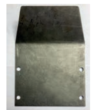
Motoren-Schutzplatte verzinkt 57.-