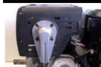
Abgasabweiser lang 18431-ZH8-W501 10.-