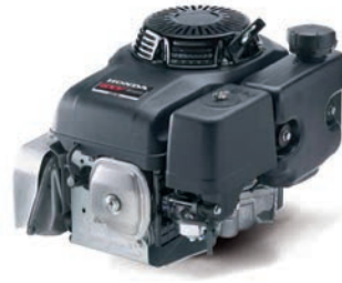
GXV 390 Seite 6