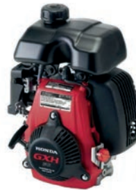
GXH 50 Seite 2