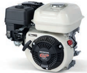
GP 160 / 200 Seite 5